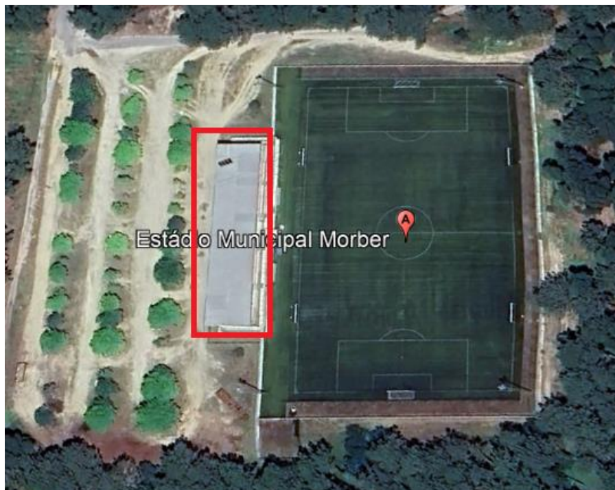
Figura 1. Vista aérea do Estádio de Morber

O presente projeto tem como objetivo a implementação de um projeto de sistema de aquecimento AQS no edifício do Estádio Morber, localizado na localidade de Cristelo.